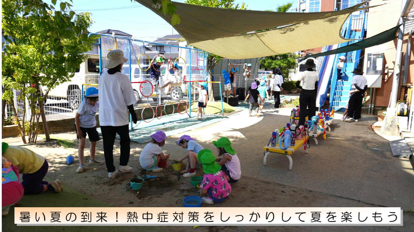
暑い夏の到来！熱中症対策をしっかりして夏を楽しもう

いよいよ7月に入ります。もうすでに真夏日の日があり、子ども達も外から帰ってくると顔が真っ赤で沢山の汗をかいています。帽子を被り水筒を持ち適度な給水タイムをとることで熱中症を防ぐようにしています。夏は、これから本番です。園庭には、日よけのタープを張りました。また、水遊びやプールも始まるので、駐車場側に目隠しも設置しました。今年の夏は、どのような夏になるかは分かりませんが、対策をしっかりして、子ども達には元気に過ごしてもらいたいと思います。